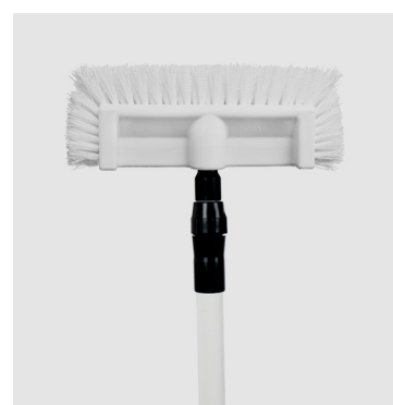
Harja DB-01 takaa- päin.