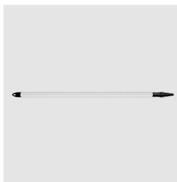
Teleskooppivarsi harjoille TB-01 ja DB-01. Pituus 20-135 mm. Koodi TH-01