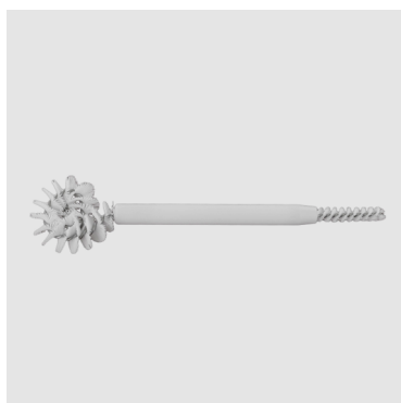
Pohjaviemärin puhdistukseen. Koodi 545