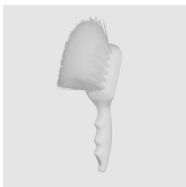
Yleispuhdistusharja Koodi USN-01