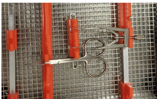
Kaihikori menossa sterilointiin sakset suljettuna. Sama kori kuin pesussa, ainoastaan sakset käännetty toisin päin. Sakset ei vät kosketa yläpuolella olevaa instrumenttia.