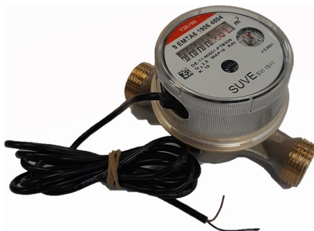
EPW –huoneistokohtainen langallinen impulssivesimittari